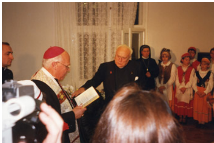
Poświęcenie biura HLI w Gdańsku 25 lat temu.